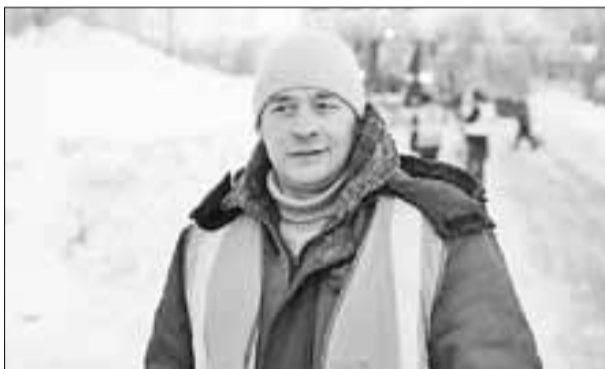
Рабочие «Архкомхоза» наводят порядок на улице Федора Абрамова.