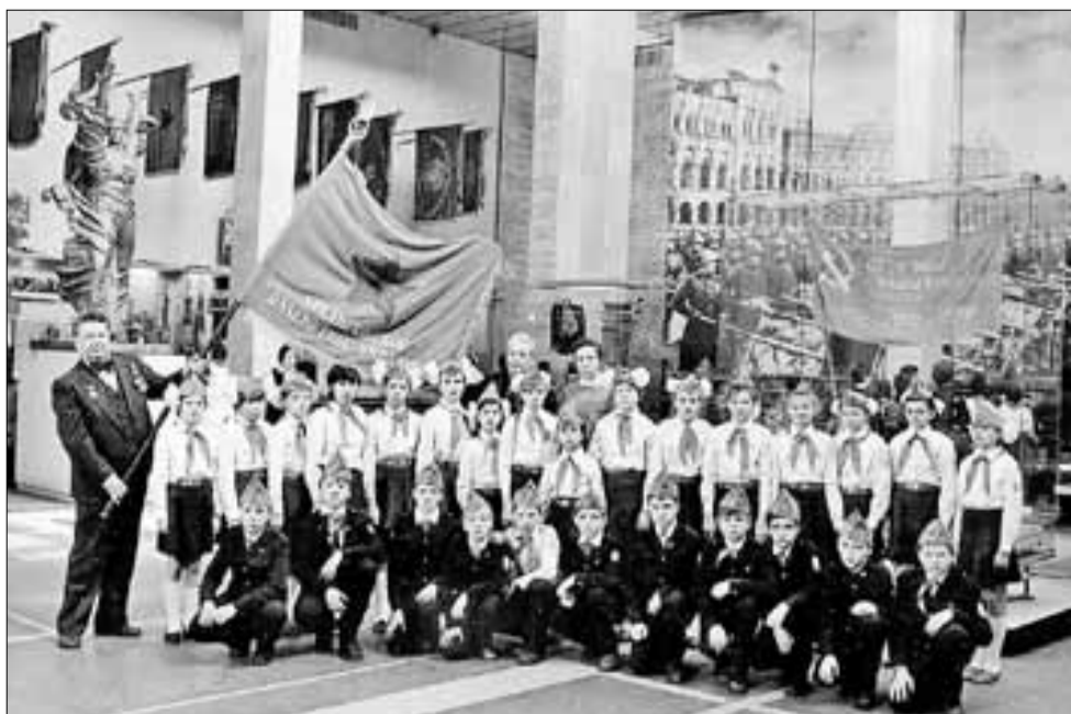
■ В 1985 году ученики 73-й школы побывали в Центральном музее Вооруженных Сил в Москве, где хранится знамя Архангельского пулеметного училища