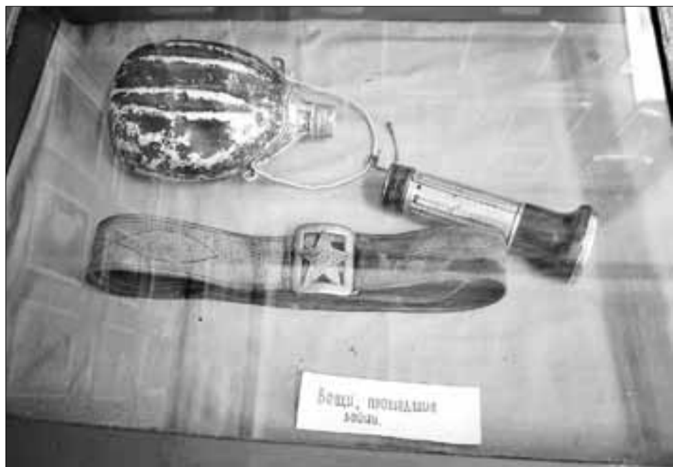
■ Экспонаты школьного музея