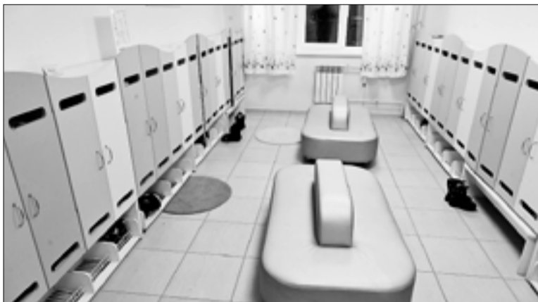
■ Предпринимателей, которые открывают частные детсады, мэрия поддерживает с помощью конкурса на получение субсидий

– Городская комиссия приняла решение не повышать арендные платежи за использование муниципального имущества для субъектов малого и среднего бизнеса, – заявил мэр. – Для 309 малых предприятий и предпринимателей, арендующих муници-