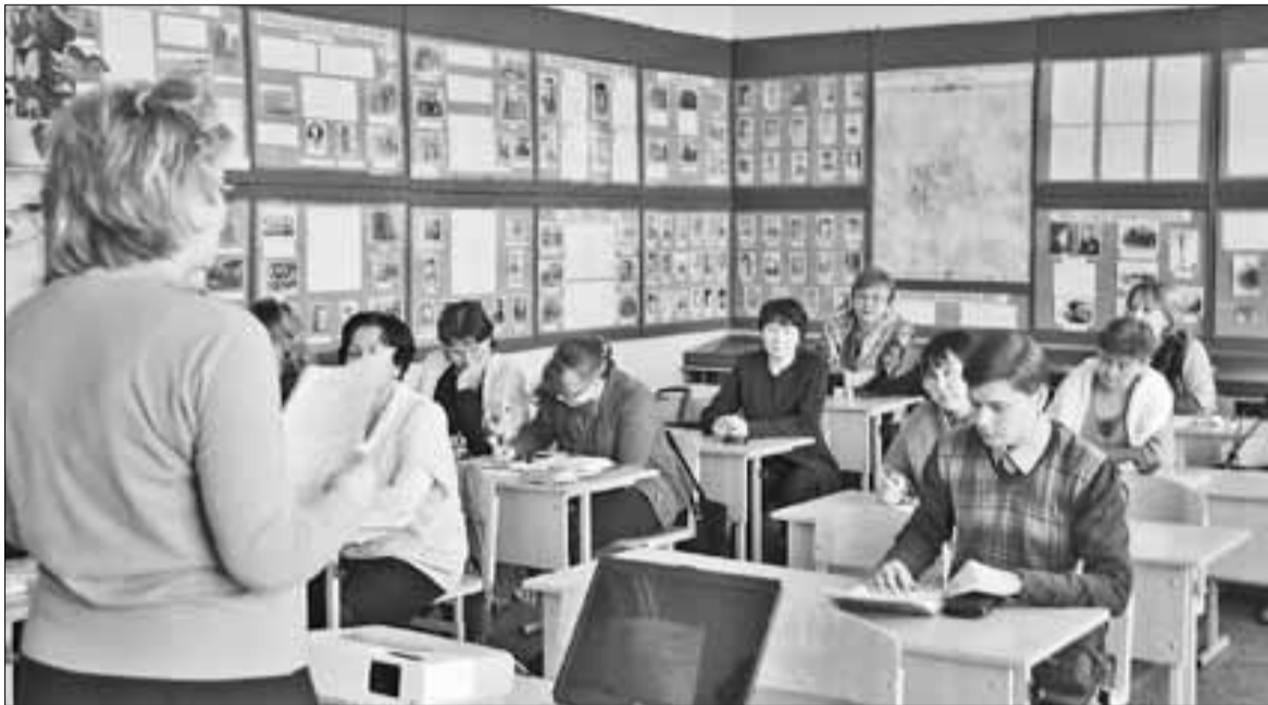
■ Участники выездного семинара руководителей школьных музеев