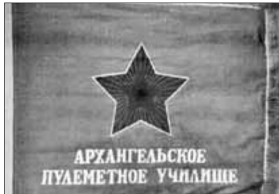
■ Знамя пулеметного училища

Татьяна Рямова обращает внимание участников семинара на стенды с фотографиями выпускников. Она говорит, что все отправленные на фронт курсанты и офицеры показали себя в боях как храбрые и