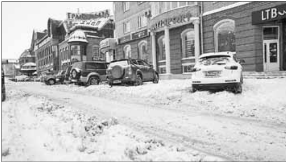
■ Владельцы торговых центров в Архангельске не спешат убирать свои территории

– Если город собирает около 20 миллиардов рублей налогов и отчислений, а в итоге ему оставляют 5,4 миллиарда и говорят: ни в чем себе не отказывайте, то сложно что-то сделать. Если бы деньги, со-