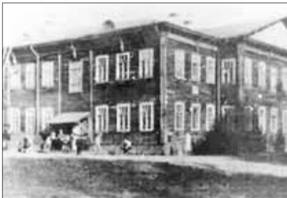
■ Здание пулеметного училища

Цигломени и Кегострове, Чудинов плотно занимался, как сказали бы мы сегодня, и социальной сферой.